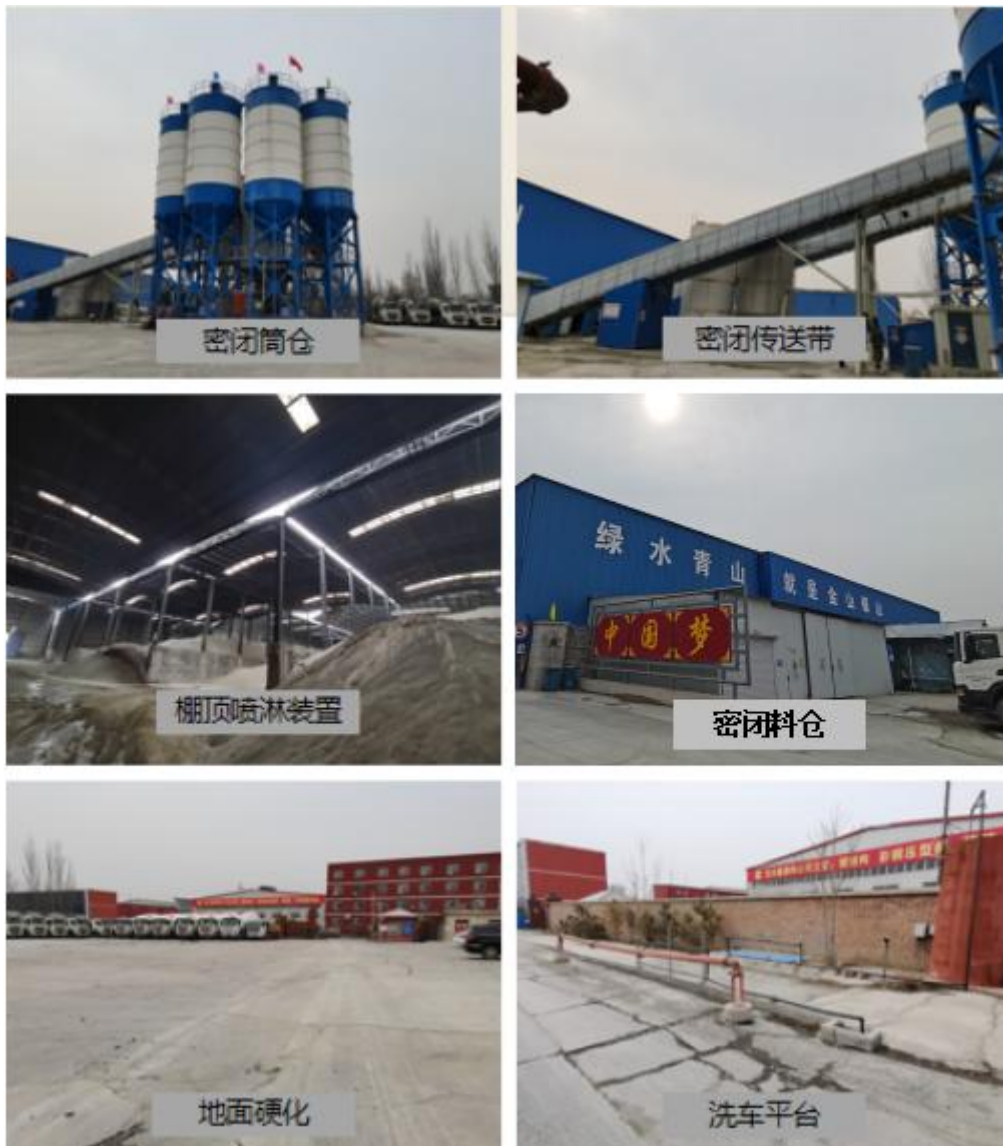
图 3-2 项目密闭车间照