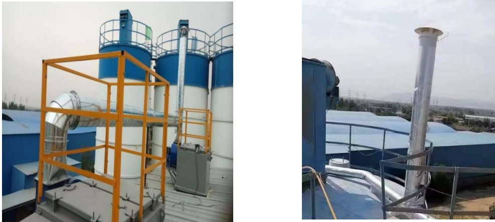
图 3-1 项目除尘设备照片