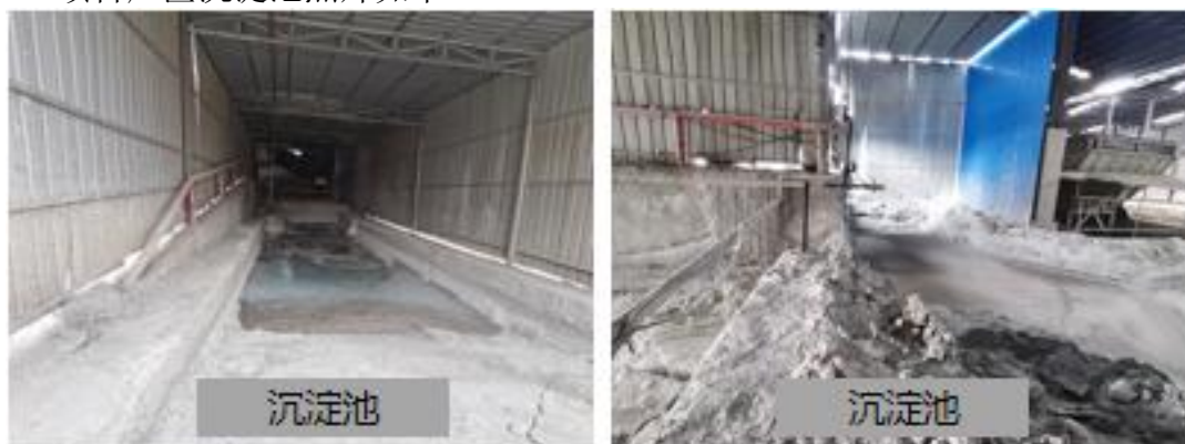
图 3-3 项目沉淀池照片