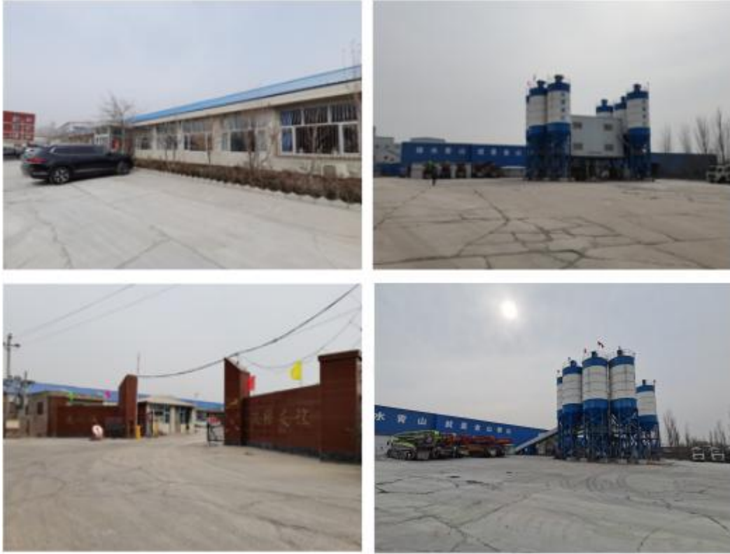
图 3-4 项目厂区现场照片